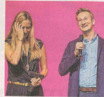
Agentur florianmatthias mit Kunde Black Diamond.