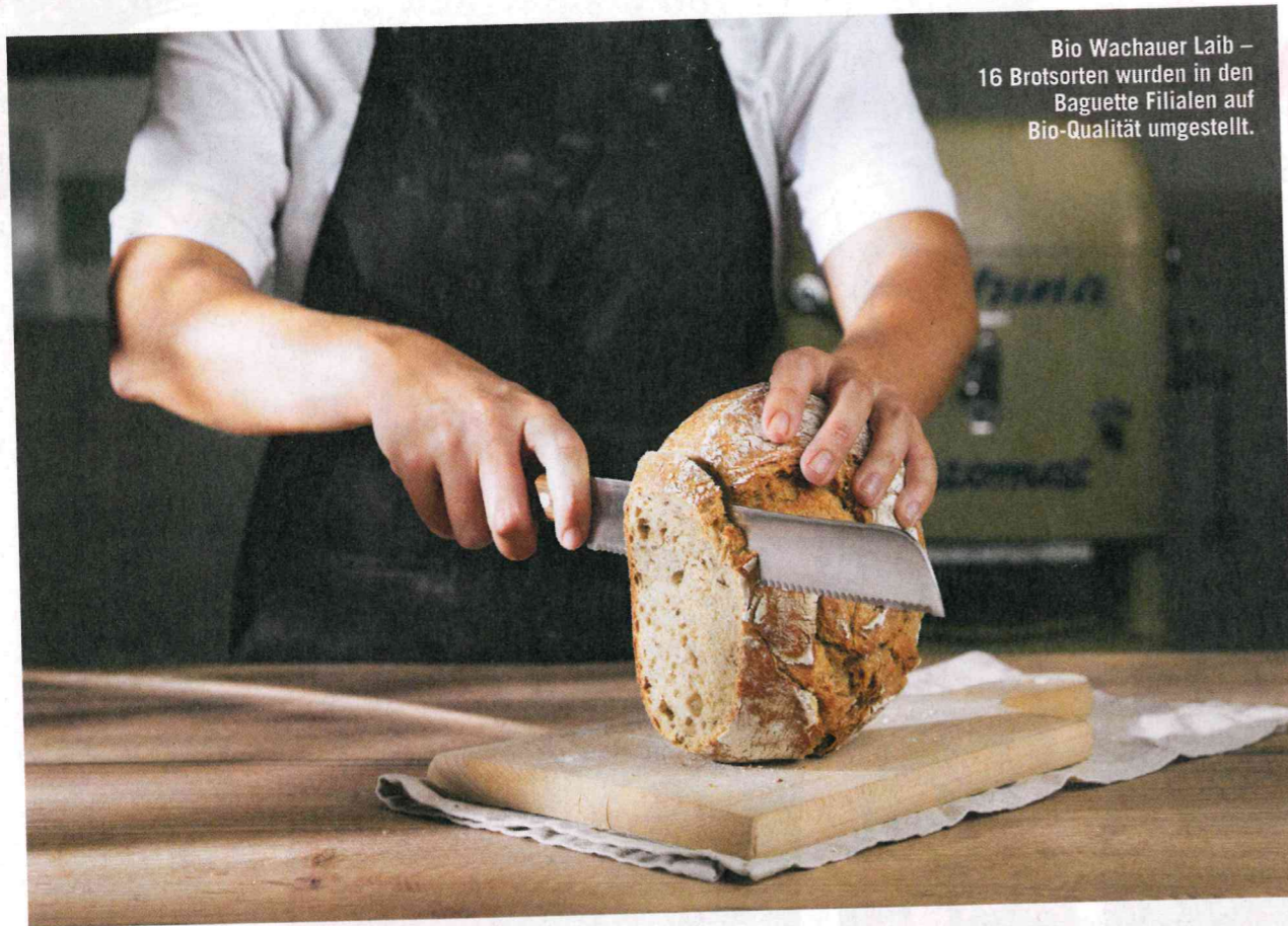
Bio Wachauer Laib – 16 Brotsorten wurden in den Baguette Filialen auf Bio-Qualität umgestellt.